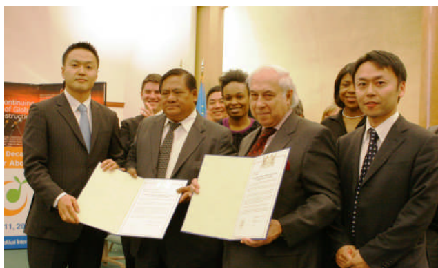
核兵器禁止条約の制定を求める署名の寄託式 創価学会青年部代表とガタン NPT 運用検討会議議長顧問 (中央左)、ドゥアルテ軍縮担当上級代表 (中央右)

この意識調査は、日本、韓国、フィリピン、ニュージーランド、米国、英国の6カ国における10代から30代の青年層を対象に、核兵器とその廃絶についての意識調査を行ったもので、4,362人が回答した。