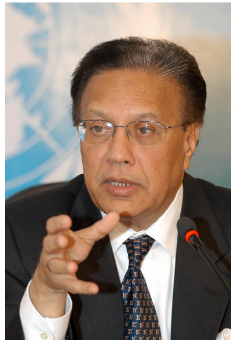
アンワルル・チョウドリ前国連事務次長

2020 年までに核廃絶を目指すグローバルキャンペーンを積極的に支援する青年運動を率いてきた白土健治創価学会青年平和会議議長は、IPS の取材に応え、「創価学会青年部が 6 カ国の青年を対象に実施した意識調査の結果は、ほとんどの民衆が『核兵器が廃絶された方が安心できる』と考えているというものでした。」と語った。